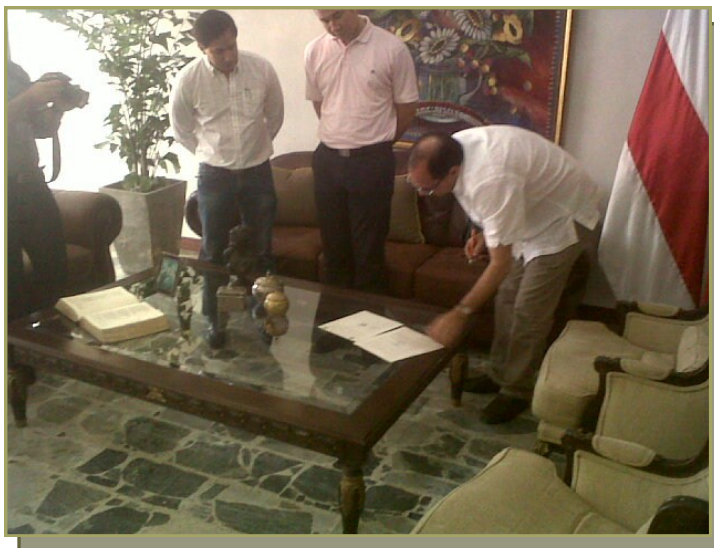
Firma de Predios entre la Gobernación y la C.R.A. para Luriza.