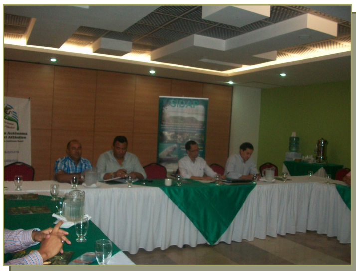
Reunión entre Alcaldes y C.R.A. para fortalecer Sistema Departamental de áreas protegidas.