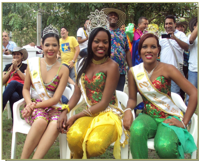
Campaña, "El Carnaval Gozando y mi Fauna Cuidando" impulsada por la C.R.A. y las Reinas populares.