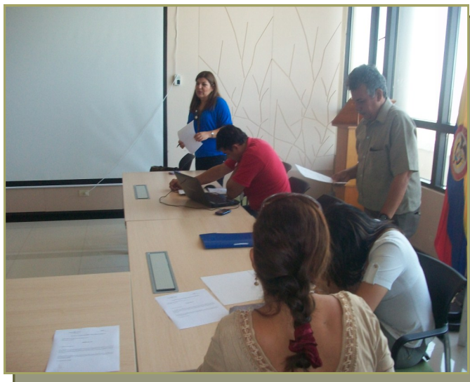
Mesa Departamental de Educación Ambiental.